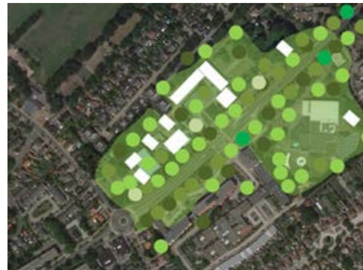
Gebouwen en plekken zijn te gast in het groen.