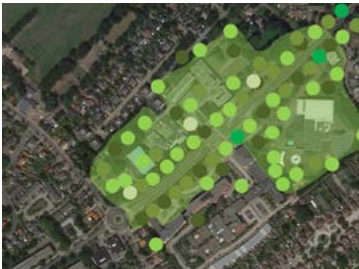
Het gehele plangebied heeft landschappelijk karakter.