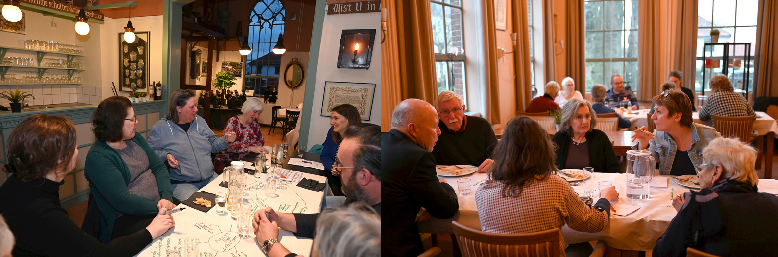
Meedenk diner Museum Soest